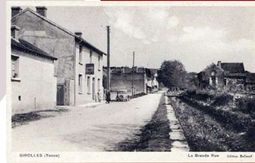
La Grande rue et le canal vers 1950

En 1876, le forgeron du village, Pierre Pouillat, est autorisé à établir un barrage mobile sur le ruisseau, "pour les besoins de son industrie". L'endroit est marqué par un emmarchement qui facilitait l'accès à l'eau, car c'est aussi là que les femmes venaient laver le linge.