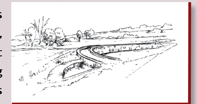
Le bassin d'orage et au fond l'étang du Briot

Les eaux du ruisseau de Girolles sont conduites dans le canal jusqu'à un bassin d'orage en pente douce, fermé par un barrage en demi-cercle. Elles s'écoulent ensuite à travers des prés humides marqués par l'étang du Briot. Sur leur passage, les eaux croisent les témoins du passé du village. D'abord les restes du château de Girolles qui se dressent au bord de l'eau, dans une vaste parcelle boisée : un beau colombier rond et, surtout, la "tour de Brunehaut" éventrée par le démantèlement du château en 1594. La massive église Saint-Didier ensuite, construite au XV e s. à flanc de coteau. Les cloches et l'horloge ont été posées en 1826. L'église fut restaurée en 1860 à l'aide notamment du "ciment de Vassy" découvert 30 ans plus tôt.