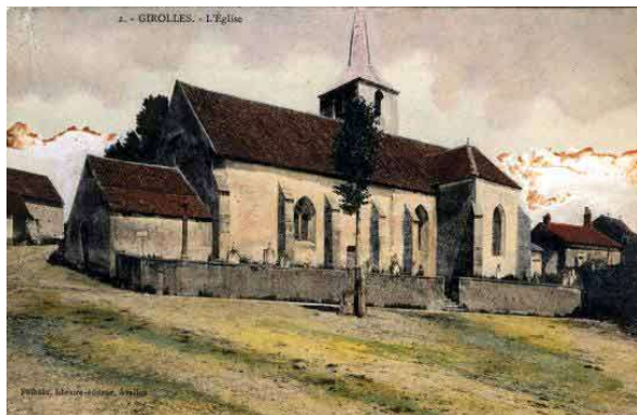
Eglise début du 20 ème siècle