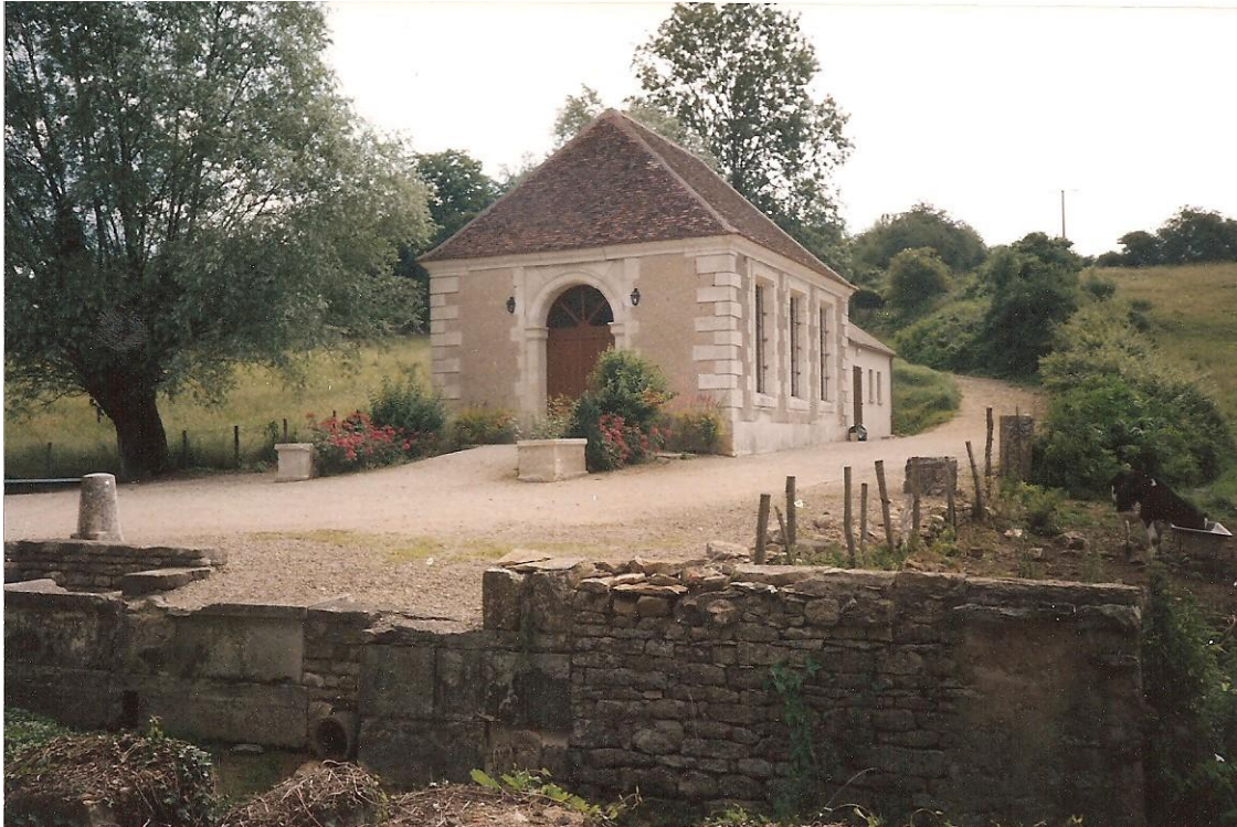
Salle des fêtes (septembre 1992)

« Le Lavoir des Grivaux dit de Pomblain, nom du châtelain et maire qui en fut le maître d'œuvre. Le devis descriptif des archives communales indique que l'architecte en est Edme Tircuit, signataire dudit devis arrêté à la somme de 8727,70 francs en février 1826. La commune dispose à cette époque de 458 ha de bois et la vente de coupes permet la réalisation du projet. Le lavoir est construit avec des moellons des meilleures carrières de pays, (Champrotard, Thizy) ; les tuiles et conduits proviennent des fourneaux d'Avallon, le fer provient des forges de Châtillon. Le portail s'ouvre sur une belle salle longue de 11 m sur 7,70 m dont le plafond à la française est à 4,80m. Un bassin à hauteur d'appui long de 6 m et large de 2.3 m, n'est plus alimenté par la fontaine tarie qui recevait jadis l'eau de 3 sources ». (Sources : l'architecture des lavoirs de l'Avallonnais par Bernard Léger).