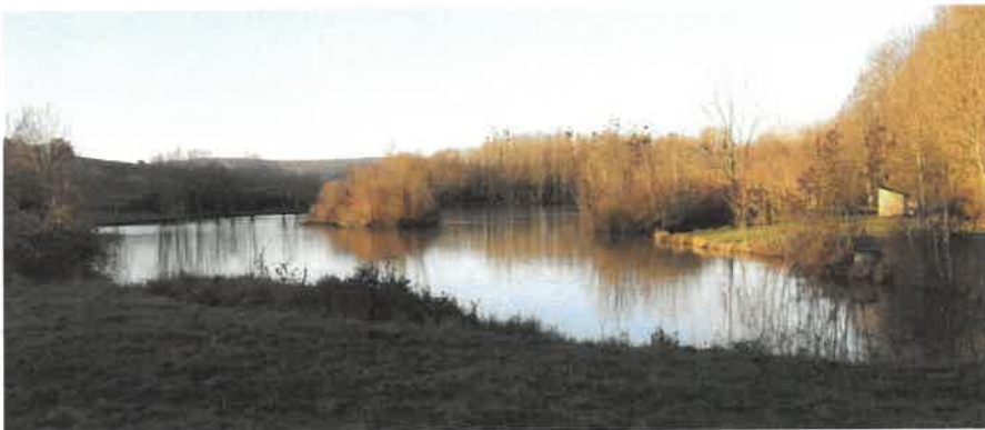
L'étang en 2018