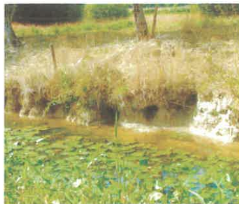
Terriers de ragondins dans la berge de la rivière La Chère

La presse rapporte régulièrement des cas graves ou mortels de leptospirose humaine parmi les piégeurs, au contact fréquent de ragondins et de rats musqués. Dans la région de l'Aisne en 2012, la leptospirose a fait deux victimes parmi les piégeurs en peu de temps. L'un d'eux s'est fait mordre par un ragondin qu'il croyait avoir tué. Au moment de l'attraper, l'animal s'est retourné et l'a mordu à la main. Dans les 24 heures qui ont suivies, l'homme est décédé. (7) En 2013, un chasseur de gibier d'eau de Gironde décédait des suites d'une leptospirose : une grippe avait été diagnostiquée au départ. (8) Toujours dans l'Aisne, un garde avait contracté la leptospirose. Le diagnostic réalisé de justesse par son médecin, qui connaissait la maladie, avait permis de gagner du temps précieux. L'homme avait toutefois effectué un long séjour à l'hôpital. (9)