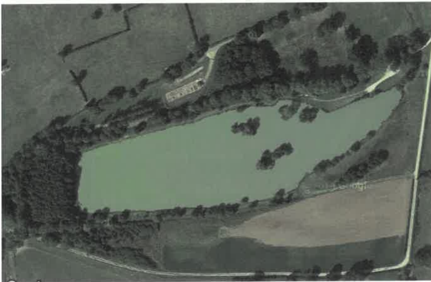
Vue aérienne de l'étang