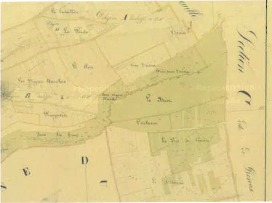
Plan cadastral de la prairie mai 1891